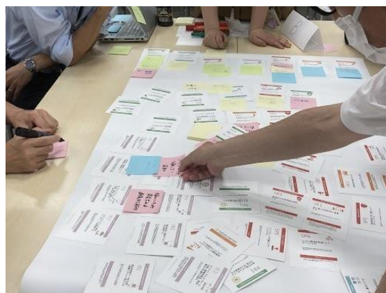
(過去のワークショップ風景)