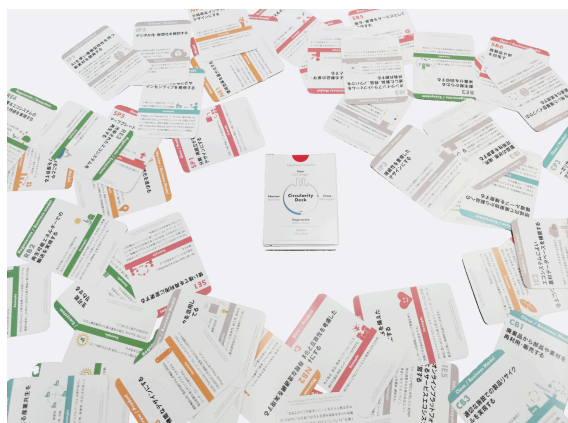
(サーキュラリティデッキ)