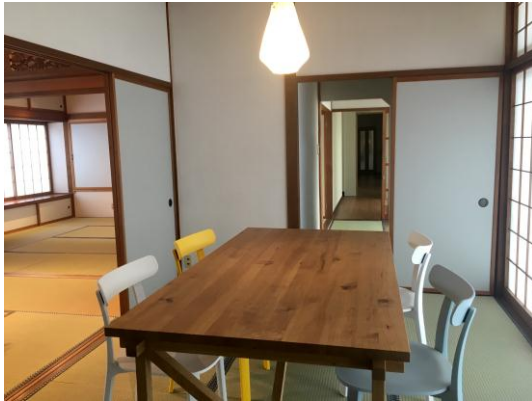
▲ダイニングルーム

OLDK (Office Living Dining Kitchen) というコンセプトのもと、リモートワーク環境が整備されるなど機能性を重視した執務室の他に、ダイニングルーム、リビングルームを設置しました。社員同士が昼食を一緒に作ったり、仕事後にお酒を飲みながらくつろいだり、まさに「暮らすように働く」ことで、都会のオフィスでは味わえない充実した働き方を実現します。