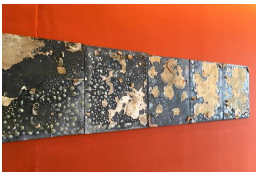
▲越前焼を利用した装飾