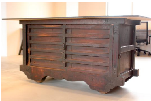
▲越前箆笥をリメイクしたミーティングテーブル

約20年前まで旅館として使用されていた2階建て空き物件をオフィスとして再生しました。リノベーションに際し、地元の伝統工芸職人グループ「福井7人の工芸サムライ」と協業して、眼鏡・漆器・箆笥等の地場産業の素材・技術を内装の一部に活用しています。