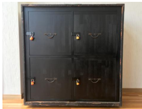
▲越前箆笥をリメイクした個人ロッカー