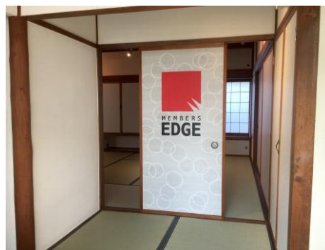
▲越前和紙で作ったコーポレートロゴ