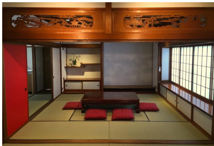
▲地域との交流を生むコミュニティースペース

1階の一部に、メンバーズエッジのエンジニアと地域の職人やデザイナー等との交流スペースを設けています。東京では実現が難しい地域とのつながりづくりによって、互いに創造性を刺激し合い、エンジニアの生産性向上や地域全体での新たな連携機会の創出を狙います。