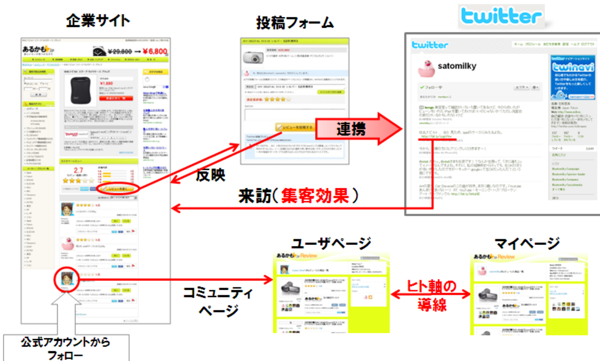
図:ツイっとレビュー 全体図

ユーザが企業サイトで投稿したレビューが、Twitter ユーザ同士の間関係(ソーシャルグラフ)によって強力なレコメンデーションとなり購買促進効果を高めると同時に、Twitter に投稿されたつぶやきが Twitter の特徴である強力な「伝播力」によって商品認知・集客効果を大幅に高めることが期待できます。更に、「ツイっとレビュー」を企業の Twitter 公式アカウント等のフォロワーを増やす施策などにも活用することにより、企業のソーシャルメディア・マーケティングの活性化を図れます。