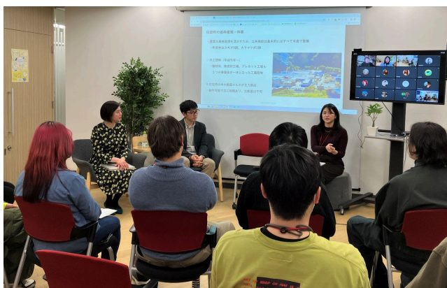
（3社によるクロストークの様子）

3月22日（金）にメンバーズ仙台拠点「ウェブガーデン仙台」にて、社員向けイベントを開催しました。ゲストに、植林による森林保全プロジェクト「メンバーズの森」に共に取り組む一般社団法人more treesさまと一般社団法人 邑サポートさまをお招きし、当社を含む3社でクロストークを行いました。当日は社員45名が参加し、「メンバーズの森」に取り組む理由や気候変動、日本の森林課題について学びを深めました。